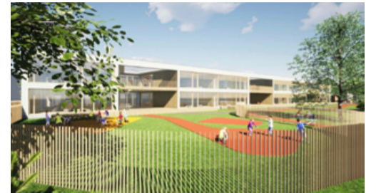
Lasteaed Maasikas saab uue hoone. Architecture Workshop Finland Oy

tatust ja müratasest. Isereguleeruva ja kiiresti kasvava minimetsa idee on alguse saanud Jaapani botaaniku ja taimeökoloogi Akira Miyawaki töödest. Sellised ökosüsteemid on kliimaeesmärkide saavutamisel võtmetähtsusega.