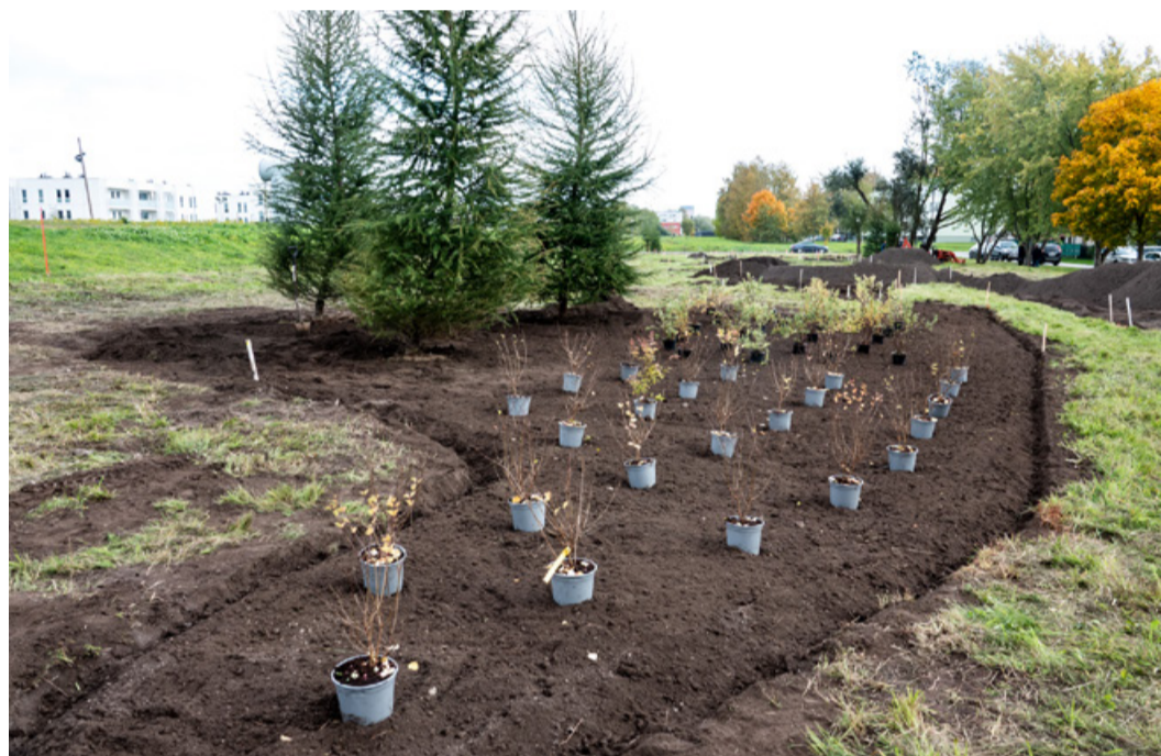
Jaapanipärase minimetsa istutamine Kristiine linnaosas, kus idee võitis mullu. Mats Ōun

Põhja-Tallinnas andis 1631 inimest kokku 2710 häält