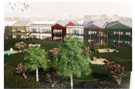
Lasteaed Kelluke valmib sügisel. Nord Projekt

Uudiseid on ka teisest minu vastutusvaldkonnast ehk spordist: aastal 2022 rajame Sõle