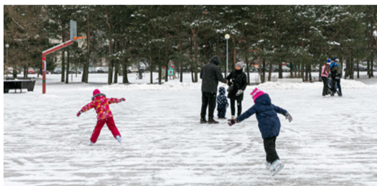
Liuväli jääb avatuks, kuni jätkub külma ilma. Ilja Matusihis

Liuväli on suuruses ca 50x25 meetrit, selle kasutamine on tasuta ja vaja on oma uiske. Teiste sõitjate ohutuse huvides pole hokimäng Stroomi uisuväljakul lubatud.