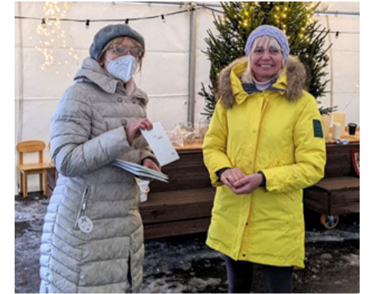
Tunnustati ligi 130 töötajat. PTS