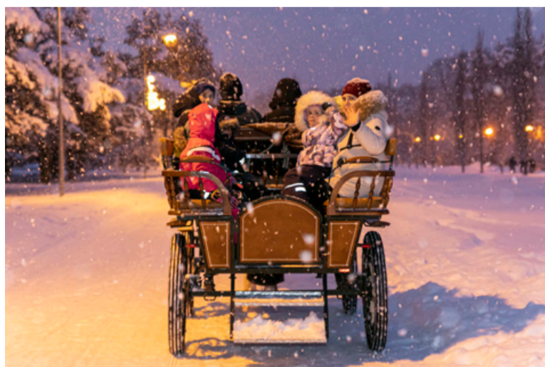
7. jaanuaril on Jõulumaa viimast päeva avatud.