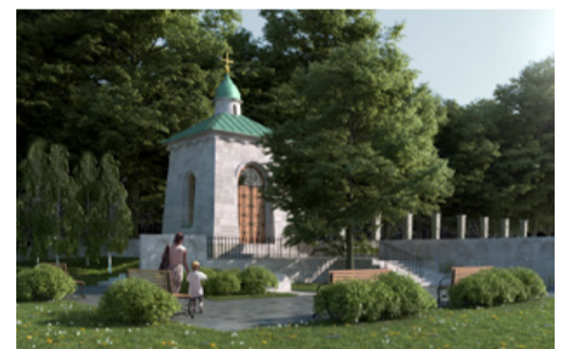
Tallinn taastab Kopli kalmistupargi memoriaalala. Ansambel OÜ